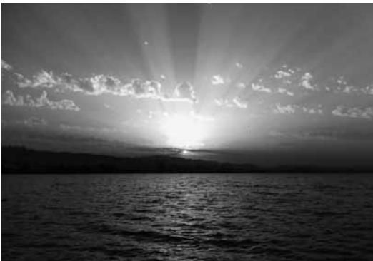
Geniale Abendstimmung bei der Seeüberquerung

Danach sind diverse Spiele angesagt, wobei man die übermotivierten Sportbillys eher bremsen muss als anspornen, aber genauso sollen Trainings aussehen. Nachdem unsere Gesichter langsam aber sicher Rot angelaufen sind, wenden wir uns dem konzentrierten Dehnen zu, um dem Körper wieder seine Erholung und seinen Ruhepuls zurückzugeben. Natürlich hat uns in letzter Zeit ein Thema nicht mehr in Ruhe gelassen, unsere amüsante Vorbereitung auf den Turnerabend. Wenn all dies noch nicht ganz reicht, wird ab und zu nach dem Training das Gesellschaftliche und die Verpflegung grossgeschrieben.